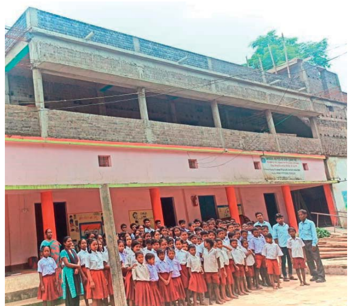
Stolze Schülerinnen und Schüler mit den Lehrkräften am neuen Anbau.

Die 2013 gegründete Organisation unterstützt eine Adivasi-Schule und ein Waisenhaus in Kutra/Rourkela im indischen Bundesstaat Orissa. Etwa 100 Kinder erhalten Hilfe, um in der rauen geografischen und sozialen Umgebung überleben zu können. Der beste Weg, um zu helfen, ist die Bereitstellung von Nahrung, Kleidung, sauberem Wasser und eine gesunde, umfassende Ausbildung.